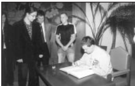
Členové 1. KCK Trutnov se podepisují do pamětní knihy města.