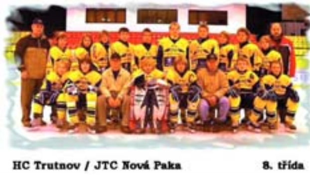
HC Trutnov / JTC Nová Paka

z 10 zúčastněných, a to pouhé 3 body za vedoucími Letci Praha - Letňany, čímž si drží dlouhodobý výkonnostní standard. Druhé místo týmu náleží za 10 vítězství, 1 remízu a 3 porážky při dosaženém skóre 73:31. Kuriozitou je to, že ještě ani v jednom utkání nenastoupili naši borci z důvodu zranění nebo nemoci v kompletní sestavě.