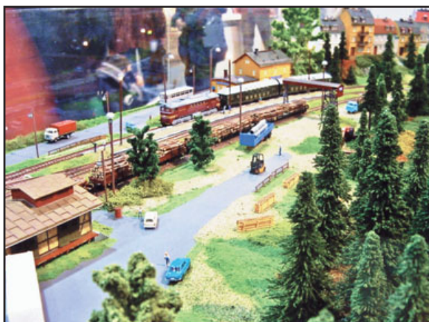
Na snímku je zachyceno kolejiště rakouských modelářů z dvojměstí Attnang - Puchheim.

zastoupena firma Merkur z Police nad Metují s kolejištěm velikosti „0“, tj. v měřítku 1:45,