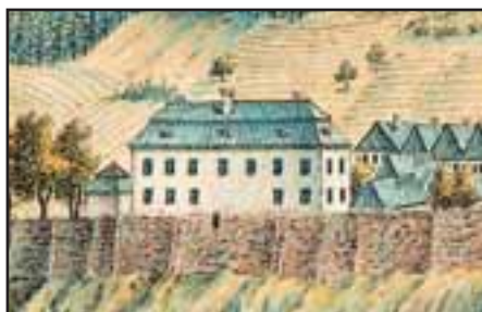
Pohled na bývalé děkanství od severu, J. Venuto, 1803, výřez

Po roce vychází v edici Odkazy vydávané městem Trutnovem pátý díl věnovaný významným stavbám města. Publikace navazuje na poslední díl pojednávající o měšťanských domech. Na rozdíl od něj se tentokrát zaměřuje na ty významné stavby města, které neplnily a priori funkci obytnou, ale sloužily ve-