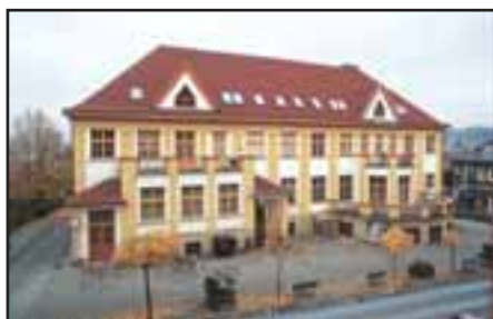
Masarykův dům, foto z roku 2005, B. Tošovský

řejnému zájmu. Počet výběrových kritérií budov tohoto typu je značný, a proto byla zvolena tři nejzákladnější: budovy správní, budovy veřejné vybavenosti a hotely. Publikace tak