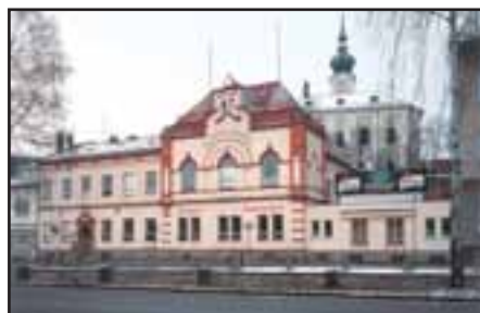
Sokolovna, foto z roku 2005, B. Tošovský

Mgr. Marek Madaj Ing. Veronika Svobodová