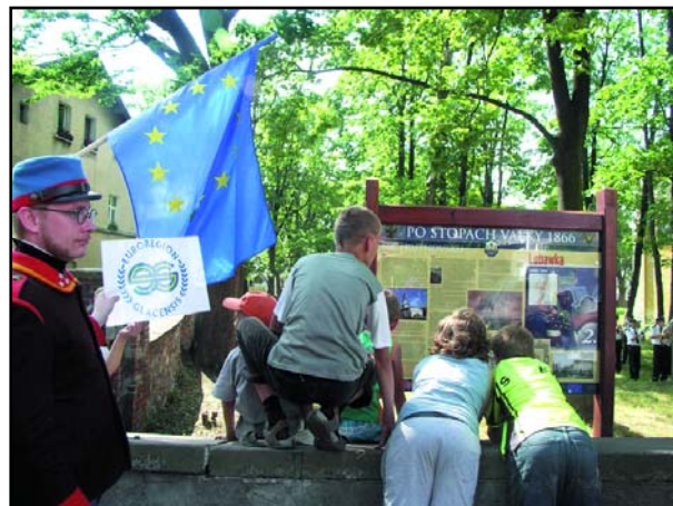
Informační tabule je v Lubawce umístěna u zdi bývalého hřbitova u kostela sv. Anny, u silnice směrem na Kamiennou Górę

Zbývajících 26 informačních tabulí je díky pochopení a spolupráci všech oslovených obcí na Trutnovsku umístěno v Bernarticích, Poříčci, Trutnově včetně okolí Janské kaple a Šibeníku, odkud naučná stezka pokračuje převážně po polních cestách či místních komunikacích ke Starému Rokytníku, Rubínovicím, do Studence, Stříteže, Starých Buků a Vlčic. Odtud se trasa stáčí k jihu přes Pilníkov a Kocbeře do Choustníkovu Hradiště,