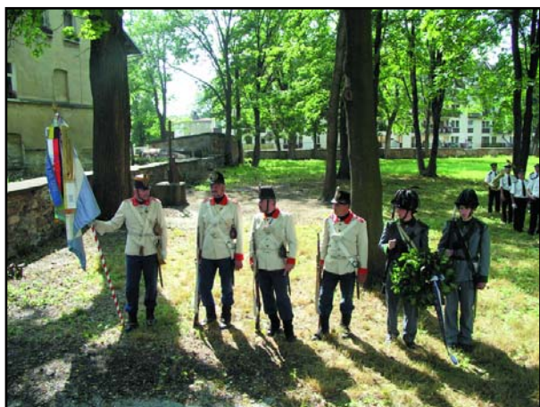
Členové KVH Trutnov při slavnostním odhalení nové informační tabule v Lubawce 15.6. 2007

Pro historii našeho města a okolí má velký význam bitva u Trutnova, kterou svedly ra-