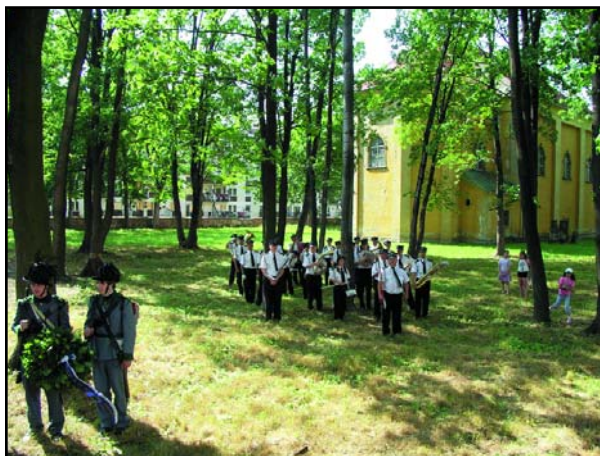
Místní dechová hudba v Lubawce doprovodila setkání několika skladbami

zitivního ohlasu občanů a návštěvníků z tuzemska i ze zahraničí schválilo zastupitelstvo města pro letošní rok rozšíření naučné stezky a zvýšení počtu informačních tabulí z původních osmi na 28 a tím pokrytí celé oblasti dotčené válkou, od Kamienné Góry na severu až po Choustníkovu Hradiště na jihu. Tam navážou další naučné stezky, které procházejí místy bojů na Královédvorsku, Jičínku, Českoskalicku, Náchodsku a Královéhradecku a které jsou z velké části také již realizované. Projekt rozšíření s názvem „VIA BELLI 1866 - Po stopách války 1866 na Trutnovsku“ je spolufinancován ze zdrojů Evropské unie prostřednictvím česko-polského Euroregionu Glacensis.