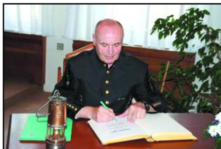
Tradiční podpis do pamětní knihy města Trutnova