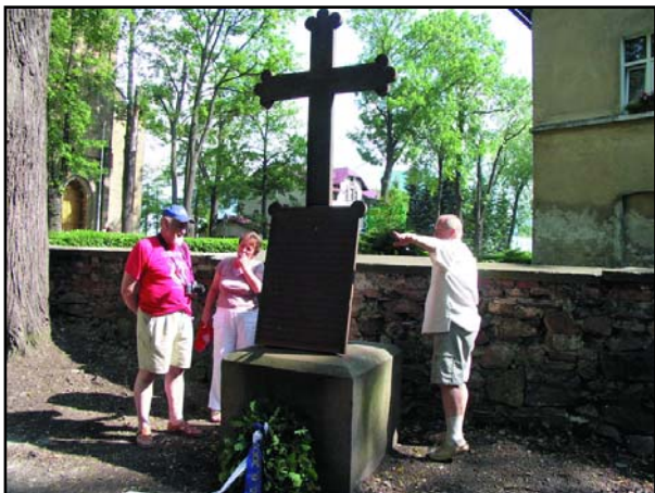
Hromadný hrob obětí bojů na Trutnovsku v r. 1866 na bývalém hřbitově u kostela sv. Anny v Lubawce - informační tabule je vzdálena jen několik metrů

všech jmenovaných obcích jsou zachovány pomníky k válce, hlavně se jedná o památníky, kde jsou pohřbeni ti, kteří zemřeli v místních lazaretech.