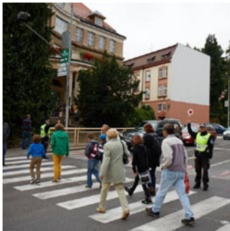
Bezpečné přecházení vybraných frekventovaných přechodů pro chodce zabezpečuje v ranních hodinách Městská policie Trutnov.

Chodci by měli mít na paměti, že neexistuje absolutní přednost chodce přecházejícího pozemní komunikaci po přechodu pro chodce. Na přechod by měli vstupovat